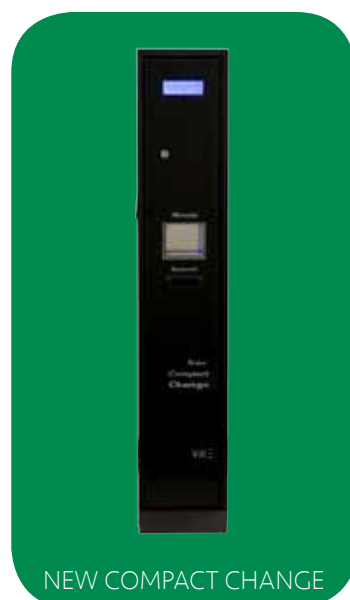
NEW COMPACT CHANGE