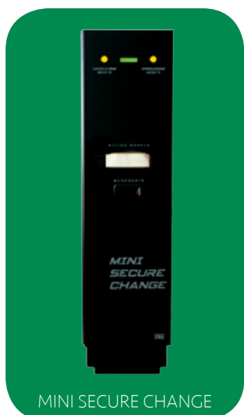
MINI SECURE CHANGE