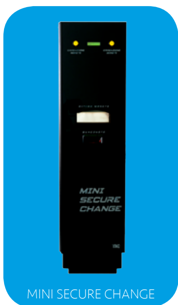
MINI SECURE CHANGE