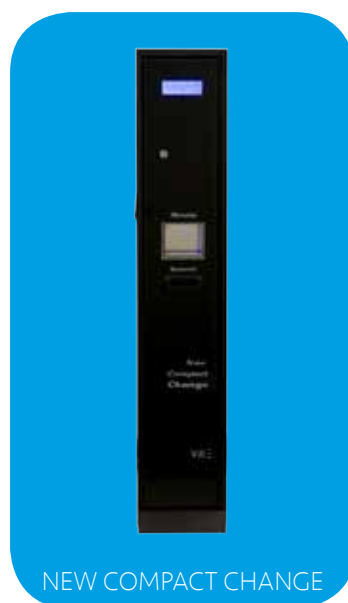
NEW COMPACT CHANGE