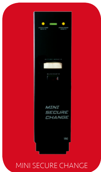
MINI SECURE CHANGE