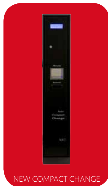
NEW COMPACT CHANGE