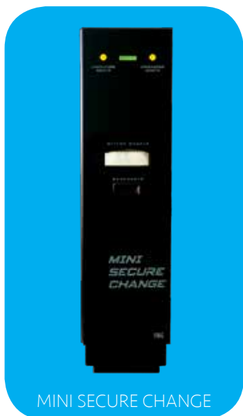
MINI SECURE CHANGE