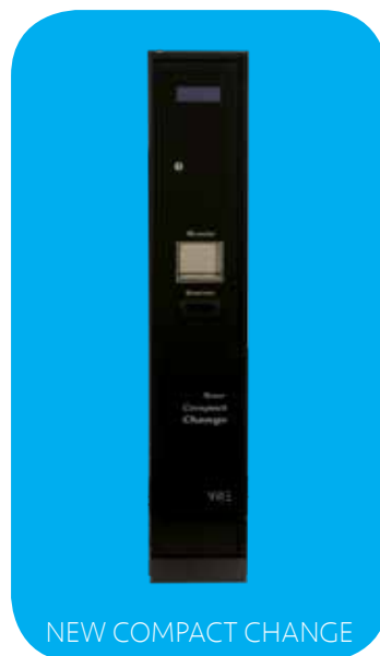
NEW COMPACT CHANGE