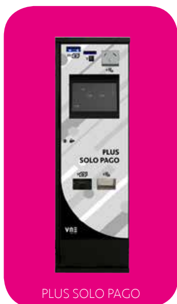
PLUS SOLO PAGO