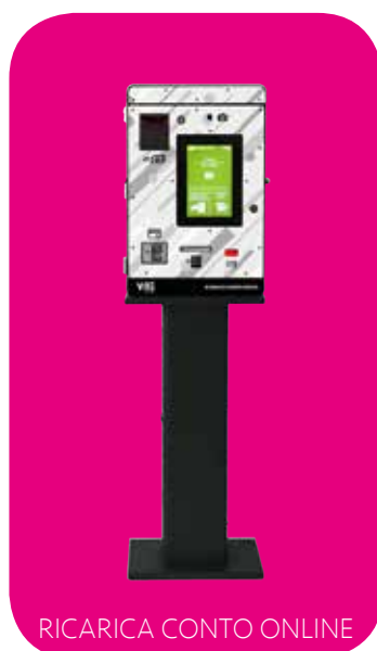
RICARICA CONTO ONLINE