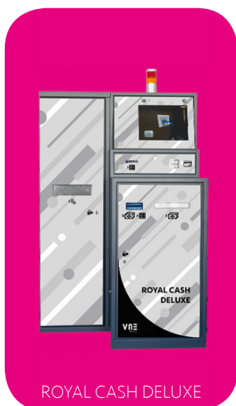
ROYAL CASH DELUXE