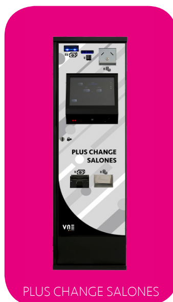
PLUS CHANGE SALONES