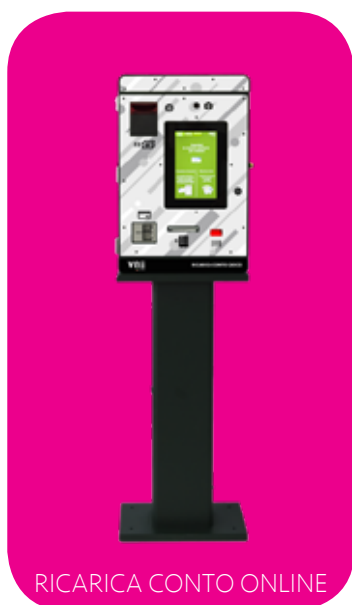
RICARICA CONTO ONLINE